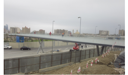
© Hoffmann – Janz Ziviltechniker GmbH