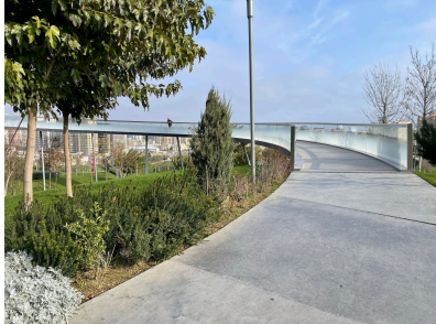
© Hoffmann – Janz Ziviltechniker GmbH