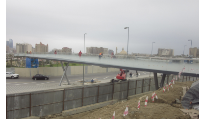
© Hoffmann – Janz Ziviltechniker GmbH