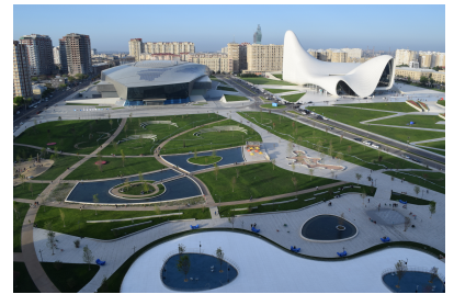
© Hoffmann – Janz Ziviltechniker GmbH