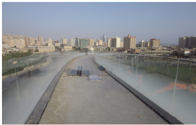
© Hoffmann – Janz Ziviltechniker GmbH