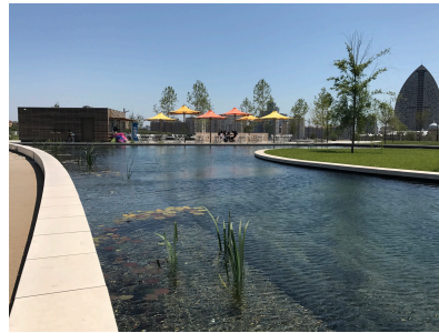
© Hoffmann – Janz Ziviltechniker GmbH