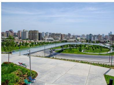
© Hoffmann – Janz Ziviltechniker GmbH