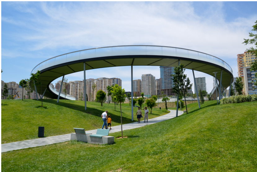
© Hoffmann – Janz Ziviltechniker GmbH