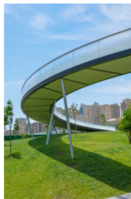
© Hoffmann – Janz Ziviltechniker GmbH