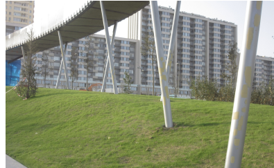
© Hoffmann – Janz Ziviltechniker GmbH