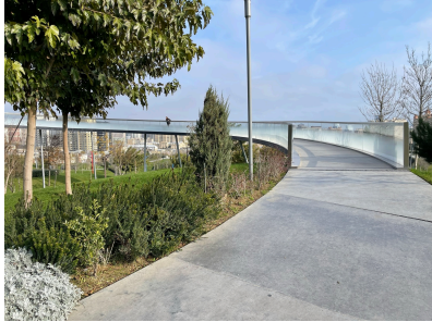
© Hoffmann – Janz Ziviltechniker GmbH