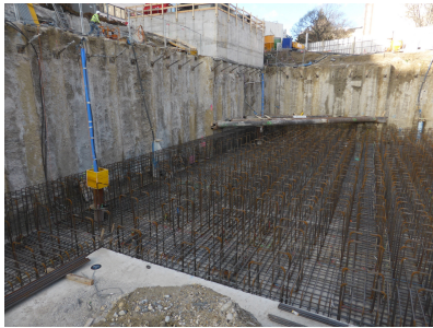
© gmeiner haferl zivilingenieure zt gmbh