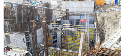
© gmeiner haferl zivilingenieure zt gmbh