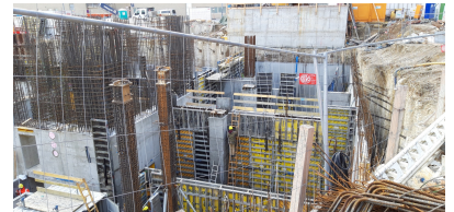
© gmeiner haferl zivilingenieure zt gmbh