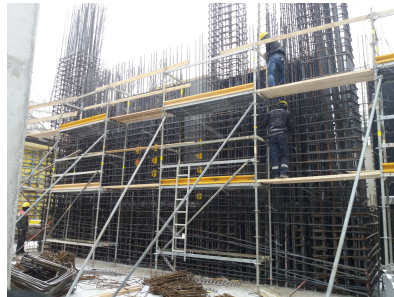
© gmeiner haferl zivilingenieure zt gmbh