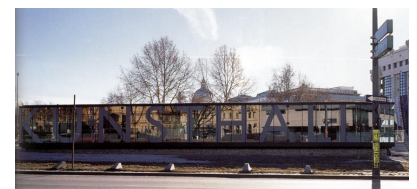
© Gmeiner Haferl Zivilingenieure ZT GmbH