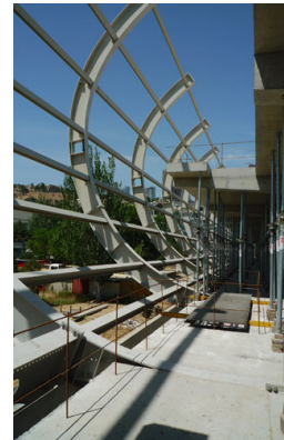
© Hoffmann - Janz ZT GmbH