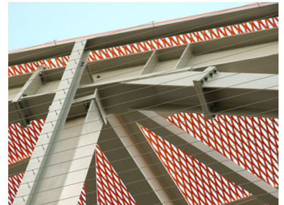
© Gmeiner Haferl Zivilingenieure ZT GmbH