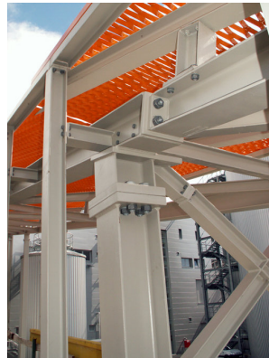
© Gmeiner Haferl Zivilingenieure ZT GmbH