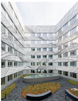
Bürogebäude und Einkaufszentrum Post am Rochus

Steffen Sailer, Kamila Schwarz, Sanja Latas, René Oberhofer